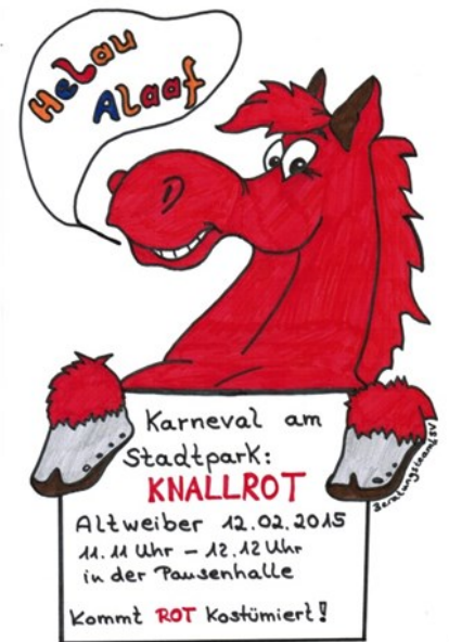
Die SV sorgt wieder für Getränke und Berliner!

Wir freuen uns, dass wir das Projekt „Schul-Shirt“ nun endlich verwirklichen können